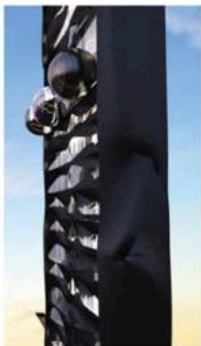
Smalste hotel van de wereld

Elke ruimte heeft een eigen functie en wowfactor. De veranderingen in de loop van de avond, met speciaal ontworpen verlichting, geven weer een andere energie en intensiteit. ME