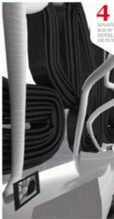
Futuristisch hangende beeldschermen